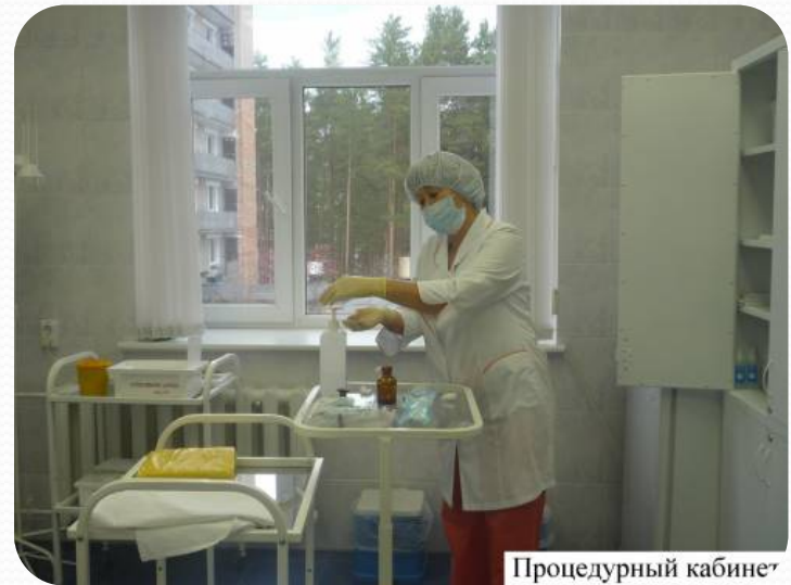
Процедурный кабинет Удмуртской Республики