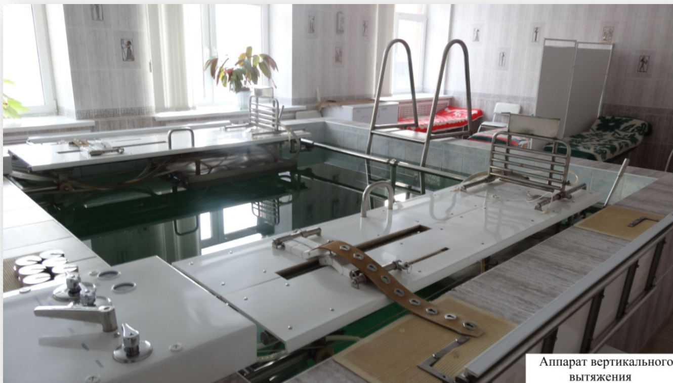
Аппарат вертикального вытяжения

Сочетанное воздействие на пациента теплой воды и тракции для снижения внутридискового давления.