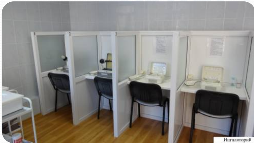
Ингаляторий Удмуртской Республики